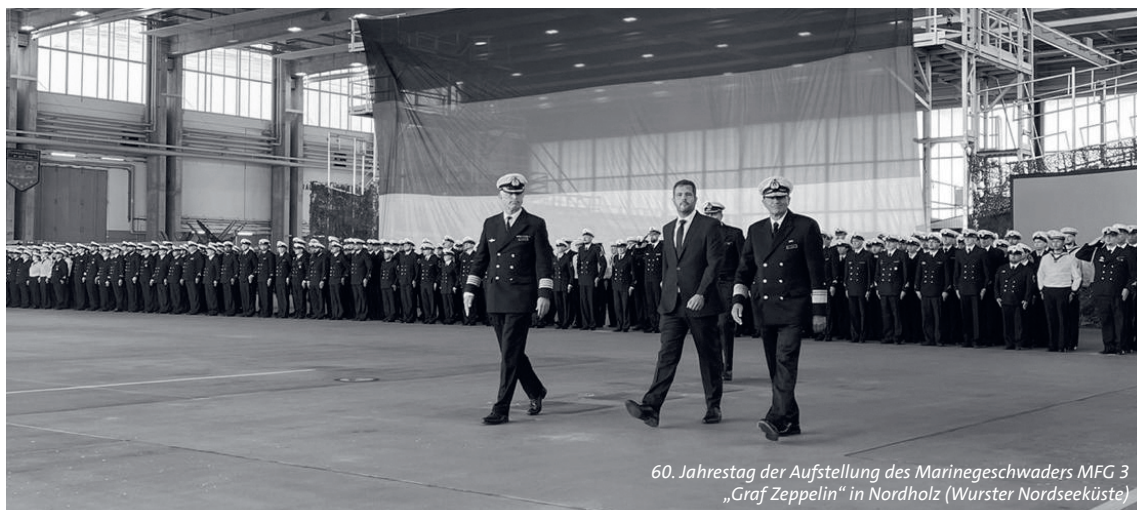
60. Jahrestag der Aufstellung des Marinegeschwaders MFG 3 „Graf Zeppelin“ in Nordholz (Wurster Nordseeküste)

F ast 80 Jahre nach dem Zweiten Weltkrieg herrscht wieder ein Krieg in Europa. Der völkerrechtswidrige und brutale Überfall Russlands auf die Ukraine stellt die europäische Sicherheitsarchitektur sowie die internationale regelbasierte Ordnung und den globalen Frieden infrage. Dennoch bleiben Frieden, Freiheit, internationale Gerechtigkeit und Solidarität sowie eine starke Europäische Union die Leitlinien sozialdemokratischer Außen-, Sicherheits- und Entwicklungspolitik. Dazu gehören auch die universelle Geltung der Menschenrechte, Demokratie und Rechtsstaatlichkeit. Wir stehen fest und solidarisch an der Seite des angegriffenen Landes und unter-